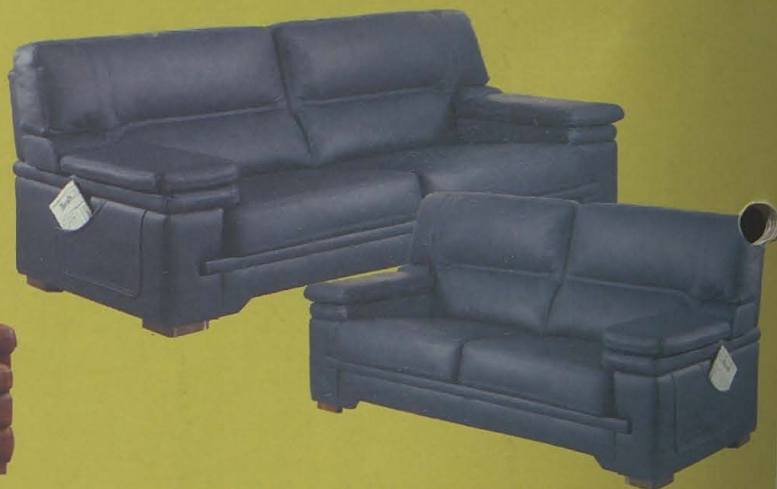
CONJUNTO 3 + 2 EN PIEL ESPESORADA