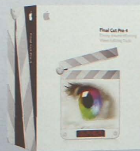
Final Cut Pro 4

Si editas video, estas son tus herramientas más profesionales