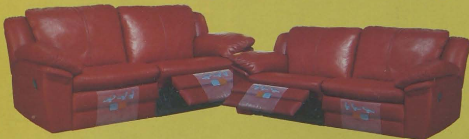
CONJUNTO MODERNO CON RELAX EN PIEL FLOR COLORES A ELEGIR