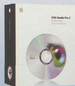
DVD Studio Pro 2