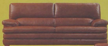
CONJUNTO 3 + 2 EN PIEL DE BÚFALO

COLCHÓN DE LÁTEX DESDE 180 € (29.900,-Ptas.)