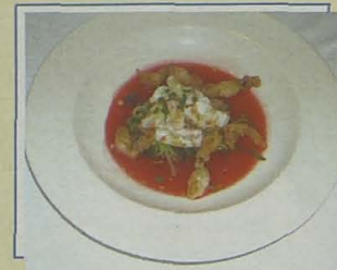
Castillo de Javier. Calamar de tres maneras

Los amantes del calamar tienen desde el pasado 1 de noviembre una cita ineludible en Salou. Diez restaurantes del municipio pondrán en sus cartas un abanico de platos temáticos, con recetas de cocina que van desde lo más tradicional a lo más moderno, y cuyo ingrediente principal, el calamar, es el elemento común. Los restaurantes que participan en la III Campaña Gastronómica del Calamar son: Quim Font, Arena, la Goleta, José Luis Arcéiz, Castillo de Javier, Portofino, Racó del Mar (restaurante situado en el complejo Universal Mediterránea), Villa Magda y La Morera de Pablo & Ester. En todos ellos se podrá degustar hasta el próximo 8 de diciembre una forma diferente de cocinar el calamar. Los platos son del todo sugerentes, con propuestas que van desde la hamburguesa de calamar, con cigala y manzana, acompañado con su maraña crujiente a la vinagreta de yogur y pepino, hasta un salteado de verduras crujientes con setas y chipirones a la plancha, adornado con piñones tostados y cebolletas confitadas.