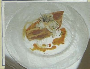
La Morera de Pablo & Ester. Tallarines de calamar