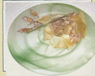
La Goleta. Calamar y rape estofado