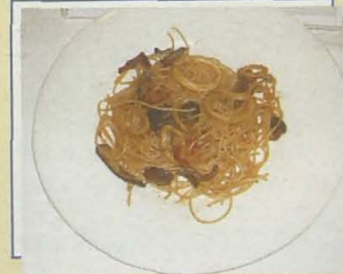
Portofino. Esnsalada tibia de calamar de playa