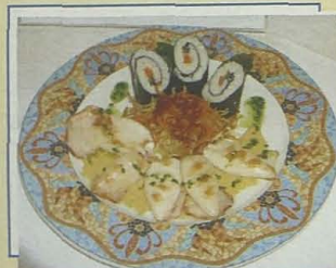
Racó de Mar Universal Mediterránea. Salteado de chipirones