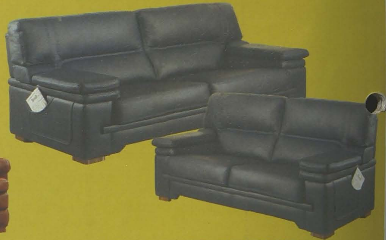
CONJUNTO 3 + 2 EN PIEL ESPESORADA