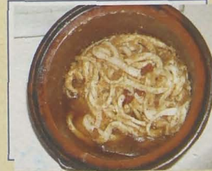
Restaurante Quim Font. Tupineta de "Calamar de Puroig"