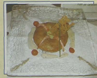
Arena. Empanada de calamar y verduras