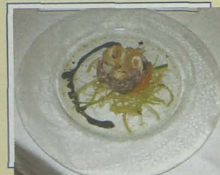
Albatros. Salteado de verduras crujientes con setas y chipirones