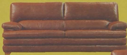
CONJUNTO 3 + 2 EN PIEL DE BÚFALO

COLCHÓN DE LÁTEX DESDE 180 € (29.900,-Ptas.)