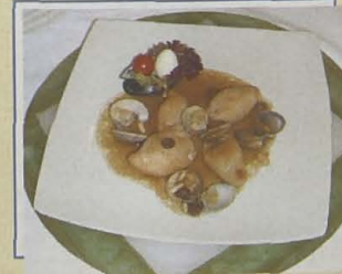
Villa Magda. Calamares rellenos