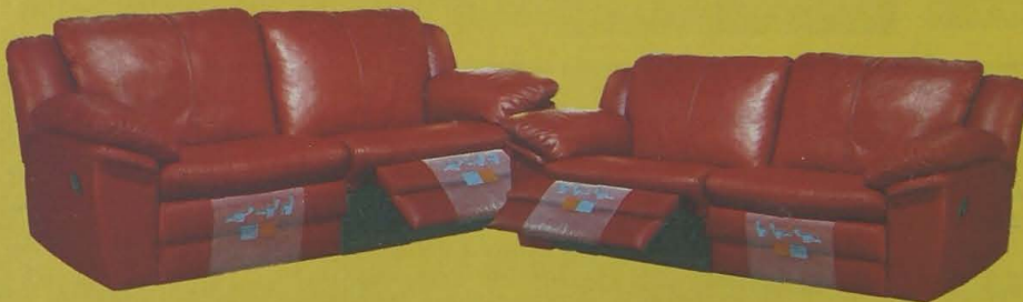
CONJUNTO MODERNO CON RELAX EN PIEL FLOR COLORES A ELEGIR