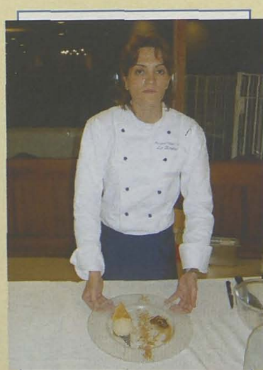
La Ibense. Crema de dátiles macerados al moscatel