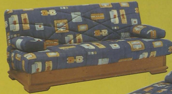
SOFÁ-CAMA CAJÓN PINO MACIZO