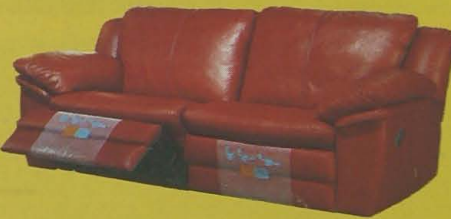
CONJUNTO MODERNO CON RELAX EN PIEL FLOR COLORES A ELEGIR