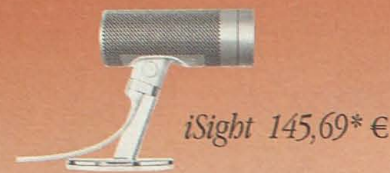
iSight 145,69* €