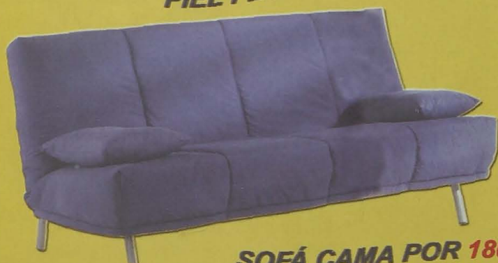
SOFÁ CAMA POR 180 €

POR LA COMPRA DE UNO DE ESTOS DOS MODELOS