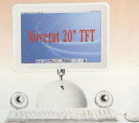
iMac des de 1.206,03* €

Aconseguix el teu Mac de sobretaula, iPod, accesoris i software amb una excel·lent financiació al 0% d'interès en 10 mesos.