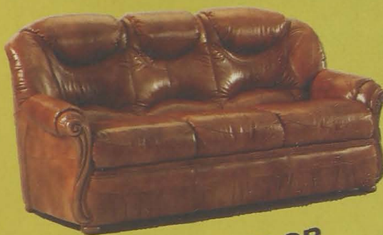
TRESILLO EN PIEL FLOR