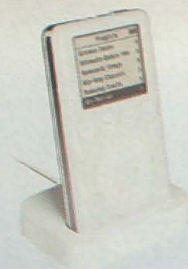
iPod des de 300,86* € Mac i Windows