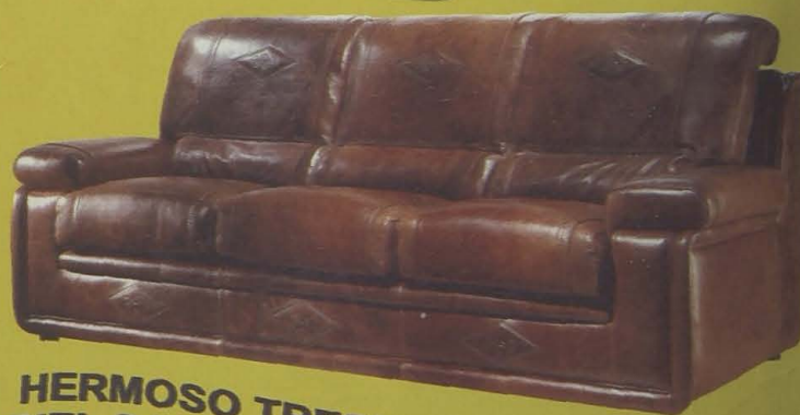
HERMOSO TRESILLO EN PIEL SALVAJE DE BÚFALO