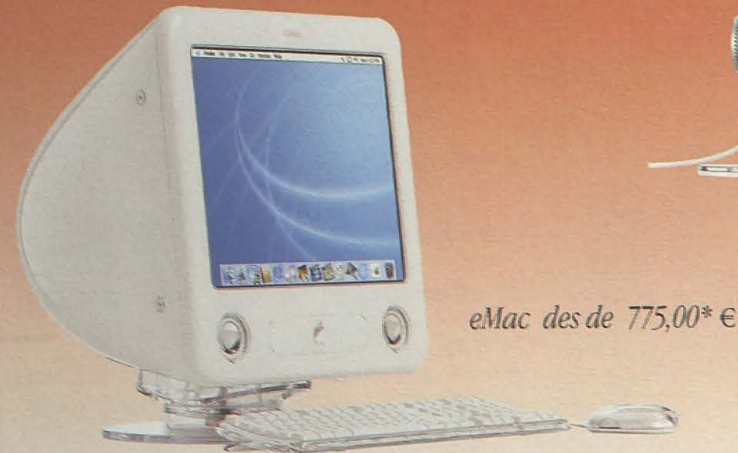
eMac des de 775,00* €

Ja no tens excuses per no tindre el teu Mac.