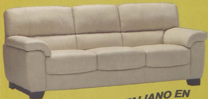
DISEÑO ITALIANO EN PIEL FLOR POR 825 €

GRANDES OFERTAS EN SOFÁS DE MÁXIMA CALIDAD. VISÍTENOS