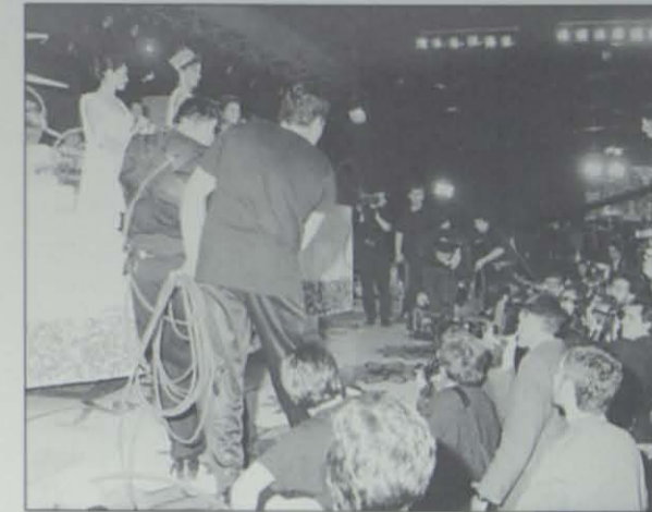
¿Cuándo te has visto en otra como ésta, Salou...?