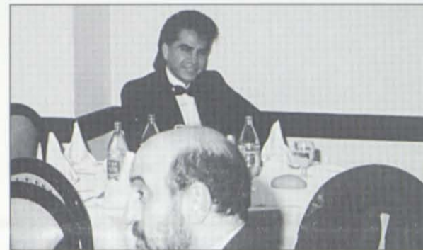
La soledad de EL PUMA.