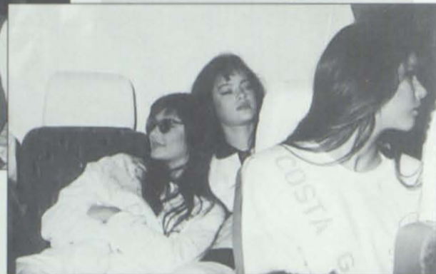
¿Cómo aguantaron tanto estas "pobres" chicas...?