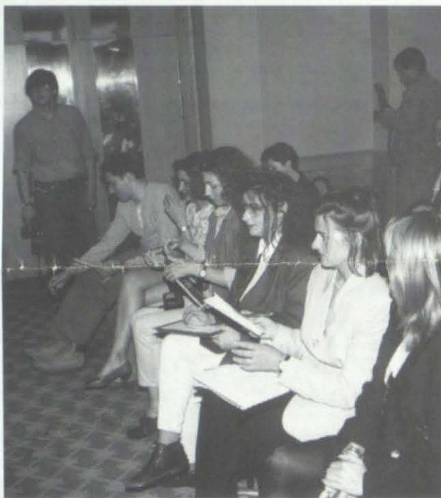
En Burgos, como en casi todas partes, la prensa parece estar cada día más en manos de las mujeres: periodistas asistentes a la rueda de prensa ofrecida por el Patronat en un hotel burgalés.

Como es fácil deducir, cada uno de estos puntos puede originar un tratado: el caso es "posar hil a l'agulla" y "manos a la obra".