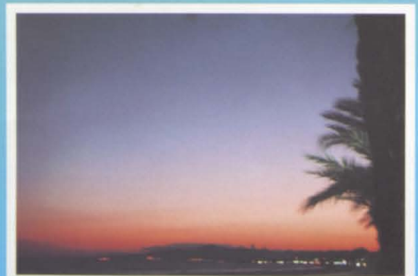
de cara al más brillante futuro que auguramos al pueblo que nos vió nacer y crecer.