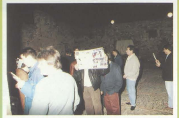
que informa e ilustra en cualquier circunstancia