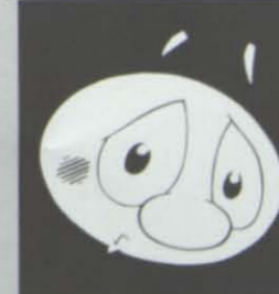
Allí estaba el SS.