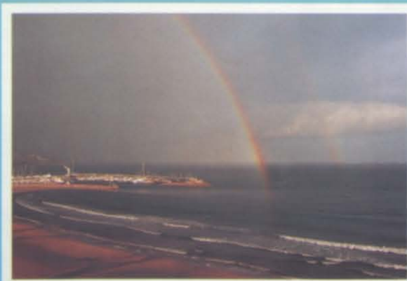
y en la calma