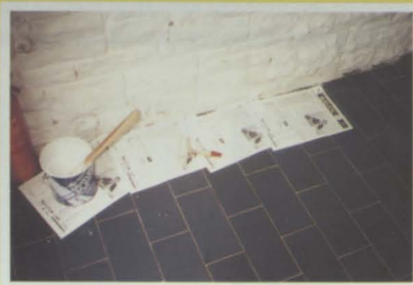
Un peripódico que sirve tanto para un roto...