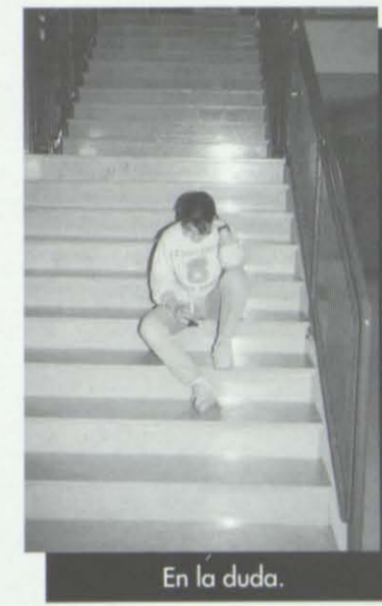
En la duda.