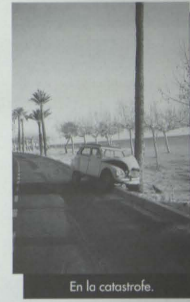
En la catastrofe.

Y en tantas insólitas circunstancias que difícilmente podemos explicar con palabras.