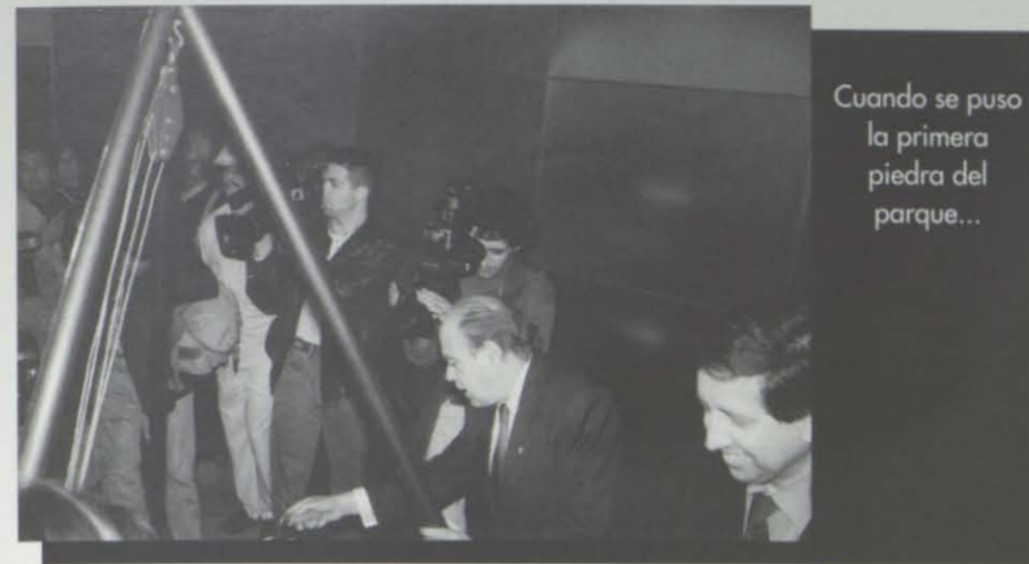
Cuando se puso la primera piedra del parque...

El Salou Setmana: presencia activa, responsable, crítica, positiva y ¿por qué no? desenfadada, a lo largo de dos años cruciales en la historia de Salou.