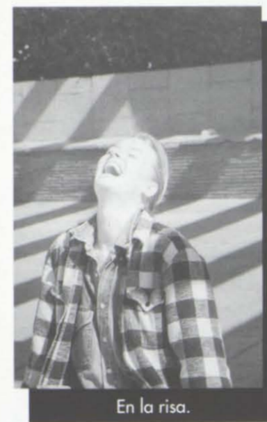
En la risa.