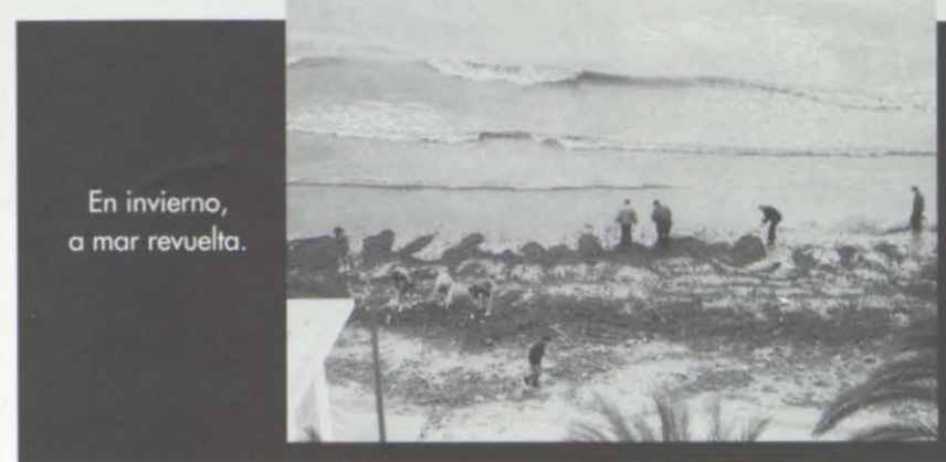
En invierno, a mar revuelta.