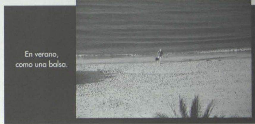
En verano, como una balsa.