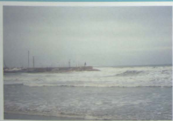
en la tempestad