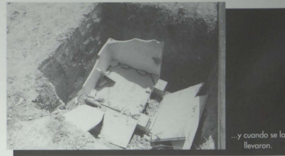
...y cuando se la llevaron.