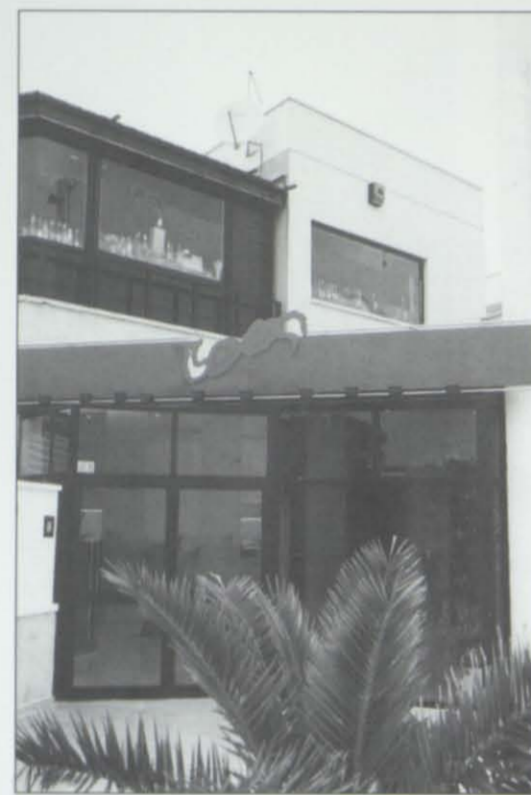
MOT BONGO, en la playa de La Pineda, la renovación que no cesa: siempre están introduciendo mejoras, por aquí o por allá y convirtiendo un lugar ya emblemático en la noche en cada vez más acogedor: no sorprenden sus llenos totales.