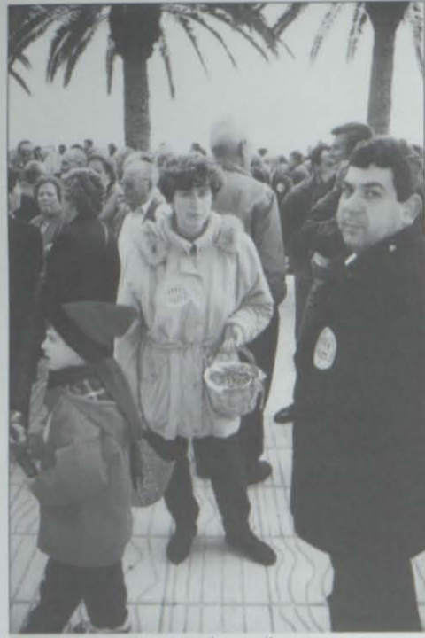
Reparto de avellanas

tiene nada que ver en el asunto: "Hemos estado aquí con un tono cívico y dialogante pero esperamos que nuestras movilizaciones no se tengan que dirigir hacia otras vías", porque "sin movernos de casa podemos conseguir que nadie venga a Salou, Port Aventura o Tarragona", tal y como ha sucedido durante los últimos cortes de carretera." (Recogidas de Diari de Tarragona, del 8 de abril). Les ahorramos el comentario, esperando que tales amenazas se queden en eso. ■