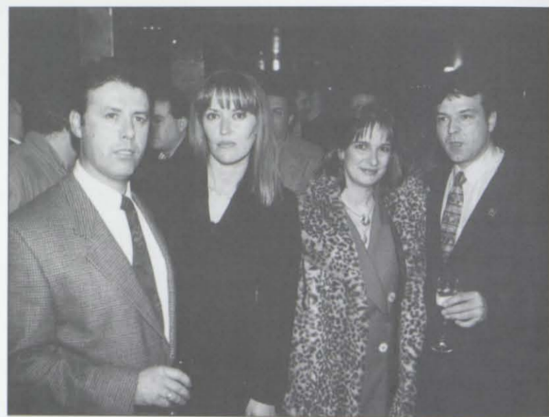
Los propietarios del TWO MUCH y sus respectivas esposas posan para el SS durante la fiesta inaugural del establecimiento, ofrecida a sus amigos el pasado 2 de abril: lleno total e inmejorables perspectivas para un negocio bien montado en un lugar igualmente bien escogido.