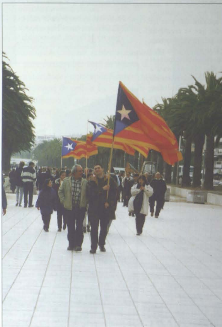
Unos curiosos visitantes de Salou: portadores de la "senyera estelada" que aparecieron en el Paseo mientras se agrupaban los pa-yeses para la concentración el pasado domingo.

diar, desde ya, un plan de activación del Paseo Jaume I, fomentando su utilización intensiva a nivel humano y lúdico desde el mismo momento en que se acaben de colocar las baldosas, diseñar un lanzamiento a gran envergadura (léanse millones de pesetas) de esos tímidos y enfrentados planes de resurrección (porque no se le puede llamar otra cosa) del Casc Antic (olvidando las puñeteras disquisiciones sobre si es o no "antic"), poner en marcha de una vez por todas, la ampliación del puerto deportivo y estudiar la dormida alternativa de una zona hotelera en las proximidades del campo de fútbol. Déjennos, de poste, lamentar el oscuro futuro que se augura para la feria y el hecho de que entre Ayuntamiento y feriantes, no sean capaces en tanto tiempo de encontrar una salida que favorezca a ambos, a la zona y al pueblo y se vean abocados a aceptar la solución impuesta desde Madrid, en el Supremo, cuando llegue. ■