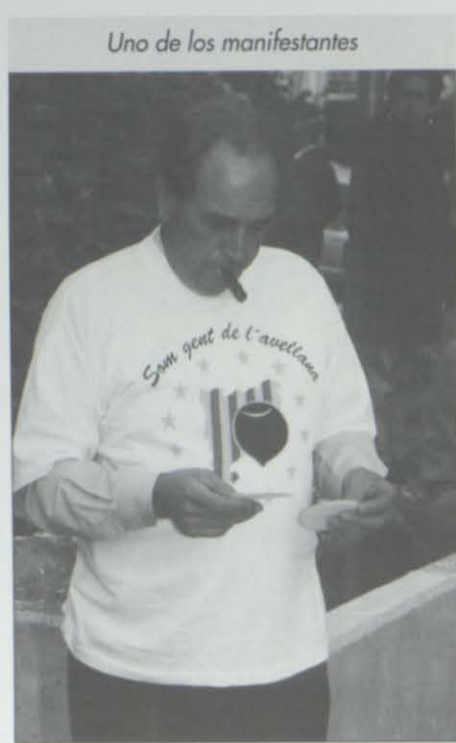
Uno de los manifestantes