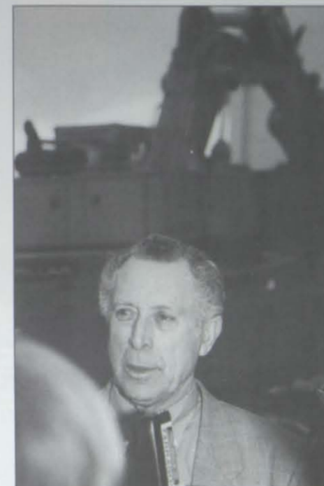
FERRAN, impulsor de la importante renovación urbanística que se está llevando a cabo en Salou

Tras la felicitación, procede destacar, también, los inconvenientes que, de nuevo o recurrentemente se presentan a quienes operan en turismo y, en definitiva, a quienes desean un Salou mejor.