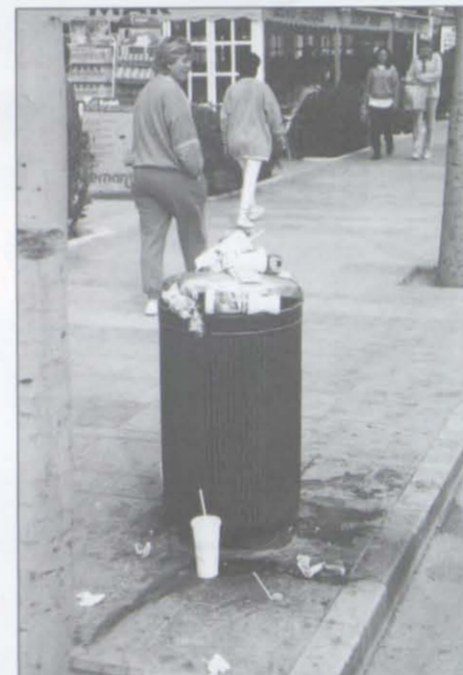
Una papeleras en el paseo: hay que arreglar este problema con urgencia.

Bien, el caso es que ha llegado la Semana Santa, se ha podido circular perfectamente (es un decir), el turista ha sacado la impresión de que Salou está cambiando radicalmente y, al fin y a la postre, las obras no sólo no han significado un menoscabo de nuestra imagen sino que, por el contrario, se ha reforzado la idea de un Salou en evolución y para mejor.