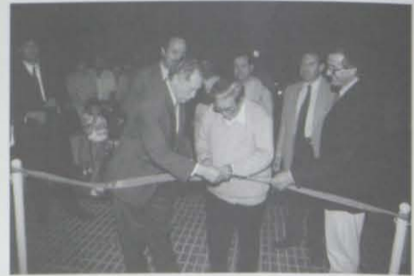
Inauguració de la primera illa de vianants de Salou, per a la promoció comercial del nucli antic.

comerciants i als seus representants. Potser a hores d'ara sigui d'una forma intuïtiva, poc definida, fosca; però és evident l'augment del nerviosisme, de les reunions i declaracions etc. Això ja és molt important i n'estic segur que en aquesta primera fase produirà no pocs malentesos i tensions. Hi ha, però, una qüestió clara que és l'inevitable protagonisme que els professionals del sector han d'assumir i que els ha de conduir a tenir presents, passi el que passi, les següents premisses: