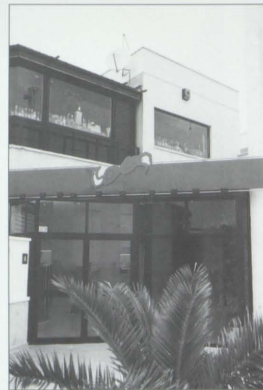
MOT BONGO, en la playa de La Pineda, la renovación que no cesa: siempre están introduciendo mejoras, por aquí o por allá y convirtiendo un lugar ya emblemático en la noche en cada vez más acogedor: no sorprenden sus llenos totales.