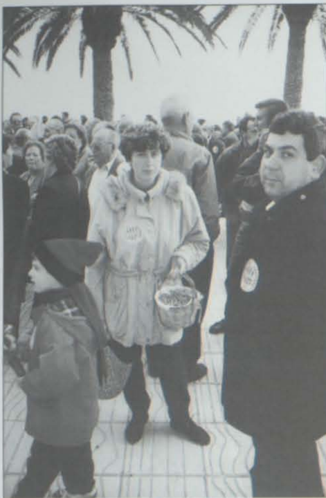
Reparto de avellanas

El pasado domingo, día 7, por la tarde, Salou recibió la visita de más de 2.000 payeses que habían decidido trasladar a la capital de la Costa Dorada sus reivindicaciones, aprovechando el llenazo de la Semana Santa. Sus peticiones se condensan en dos, ayudas directas a la producción para compensar la pérdida de renta ocasionada por las importaciones desde Turquía a bajo precio y establecimiento de la obligatoriedad de expedición de certificados de importación.