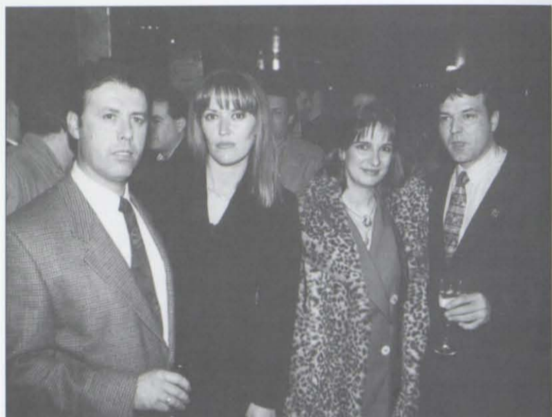
Los propietarios del TWO MUCH y sus respectivas esposas posan para el SS durante la fiesta inaugural del establecimiento, ofrecida a sus amigos el pasado 2 de abril: lleno total e inmejorables perspectivas para un negocio bien montado en un lugar igualmente bien escogido.