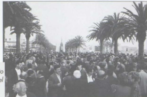
Concentración junto al monumento a Jaume I a las seis de la tarde del domingo