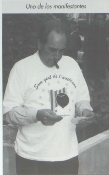
Uno de los manifestantes