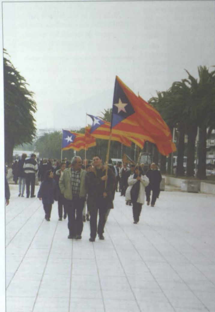
Unos curiosos visitantes de Salou: portadores de la "senyera estelada" que aparecieron en el Paseo mientras se agrupaban los payeses para la concentración el pasado domingo.

Con todo y con eso, haremos un esfuerzo especial y trataremos, por enésima vez, de suscitar debates en torno a problemas de interés general hasta que los afectados, de una vez por todas, salten a la palestra y expliquen en público lo mucho que largan en privado. Dicho sea sin ánimo de incordiar ni de poner ninguna pica en Flandes. ■