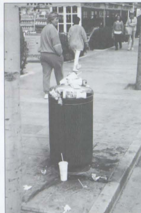
Una papelera en el paseo: hay que arreglar este problema con urgencia.

Bien, el caso es que ha llegado la Semana Santa, se ha podido circular perfectamente (es un decir), el turista ha sacado la impresión de que Salou está cambiando radicalmente y, al fin y a la postre, las obras no sólo no han significado un menoscabo de nuestra imagen sino que, por el contrario, se ha reforzado la idea de un Salou en evolución y para mejor.