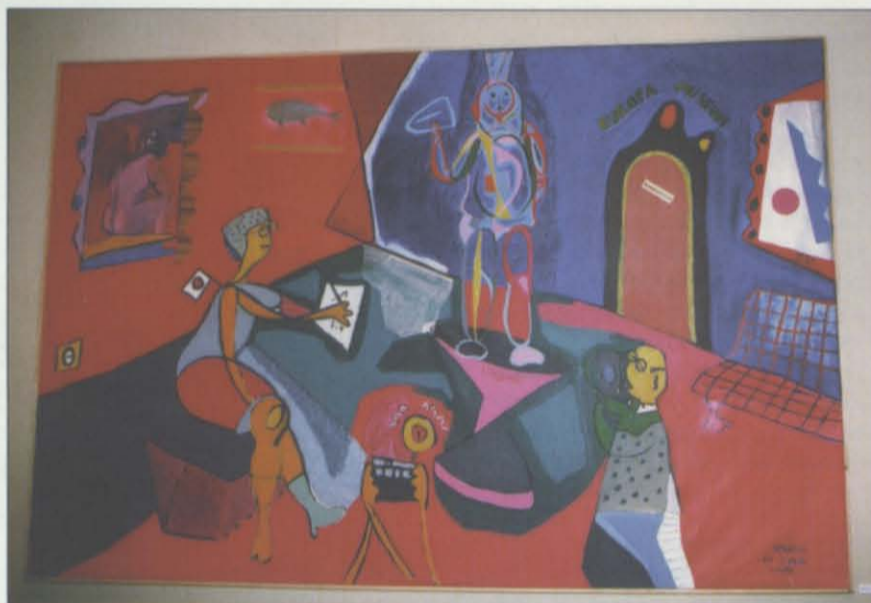
En esta ocasión, pueden contemplar las pinturas y dibujos de Jordi BIENDICHO y una interesante colectiva de joyería: hasta el 1 de mayo y por las tardes de 18 a 21 horas.