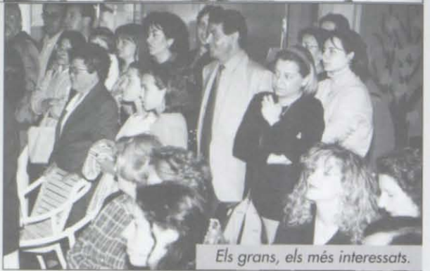
Els grans, els més interessats.

Lunes, dia 22 en la Biblioteca Municipal: presentació del tomo I de lo que pretende ser una colecció de ESTUDIS DE SALOU: se inicia con un estudio sobre la decoración del baptisterio de Santa Maria del Mar, sigue con un análisis de un poema de CARNER titulado, precisamente "SALOU", otro sobre la Guerra Civil en Salou, continúa con "Los medios de comunicación escritos de Salou" y "La enseñanza primaria en Salou de 1888 a a 1911 para acabar con una larga bibliografía sobre Salou.