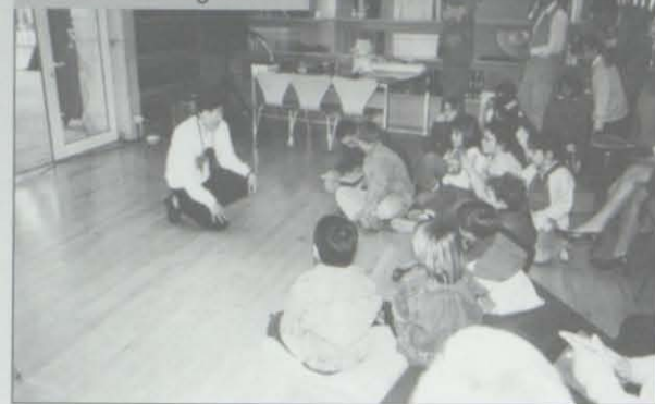
De gom a gom...