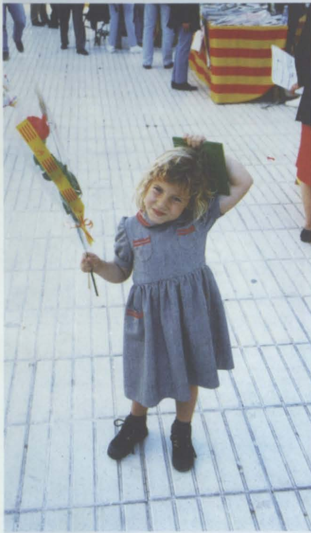
Sant Jordi 96: una imagen vale más que mil palabras.

No es a nosotros a quienes corresponde, mutatis mutandis , emprender tales aventuras. Pero sí que viene a cuento destacar el que en otras ciudades ya se lo estén planteando mientras en Salou, notable por su atractivo nocturno, no sólo no se aborda el estudio de los problemas generados por la noche sino que ésta, a ojos vistas, decae, no se renueva, pierde clientes y pierde imagen. Los empresarios de la noche en Salou culpan al Ayuntamiento de casi todos sus males: los limitadores de volumen de sonido son unánimemente señalados como el inicio del problema, agrandado por lo que se entiende como excesivo acoso policial y por la escasa flexibilidad reglamentaria. A su vez, desde la institución municipal se contemporiza con las infinitas irre-