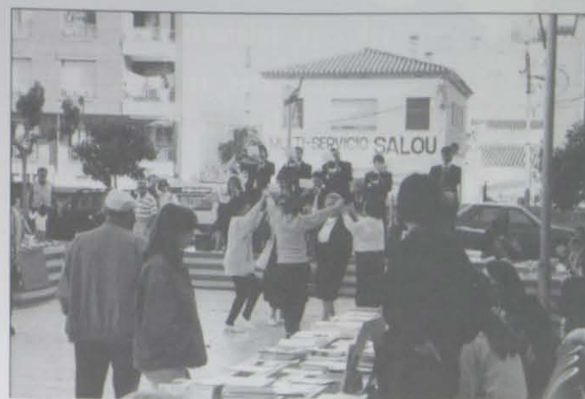
Escenas en la Plaza de Sant Jordi captadas precisamente, el día 23.

Como prueba de que la cultura brota en el interior de la persona o del grupo, ahí está el concurso de poesía organizado por el GRUPO DE DONES DE SALOU al que concurrieron casi veinte poetas. El día 23 por la tarde, se conocieron los nombres de las participantes y de las ganadoras, a las que el Alcalde hizo entrega de premios y, claro está, de rosas. Las primeras clasificadas leyeron sus respectivas composiciones y alguna hasta se emocionó... cual corresponde en el noble ejercicio de la poesía.