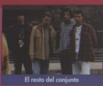
El resto del conjunto

Si mientras tanto, algún pub, hotel, discoteca o particular quiere oírles en vivo y en directo, puede llamar al teléfono 35 22 36 y hablar con Elisabeth, manager del grupo.