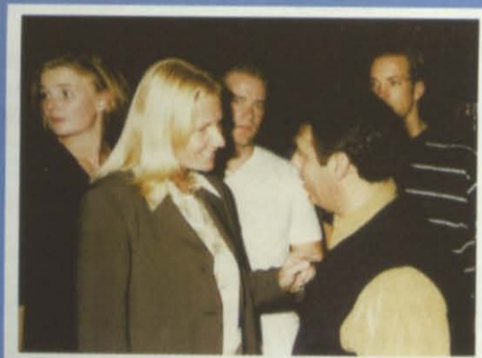
Encuentro entre amigos