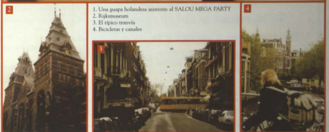
1. Una guapa holandesa asistente al SALOU MEGA PARTY 2. Rijksmuseum 3. El típico tranvía 4. Bicicletas y canales

Estamos ampliando y mejorando para ustedes el periódico por eso no saldremos la semana que viene