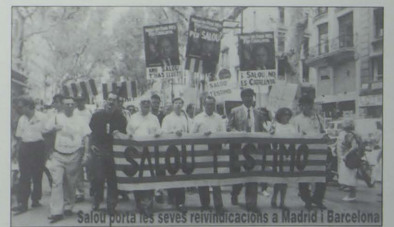
Salou porta les seves reivindicacions a Madrid i Barcelona